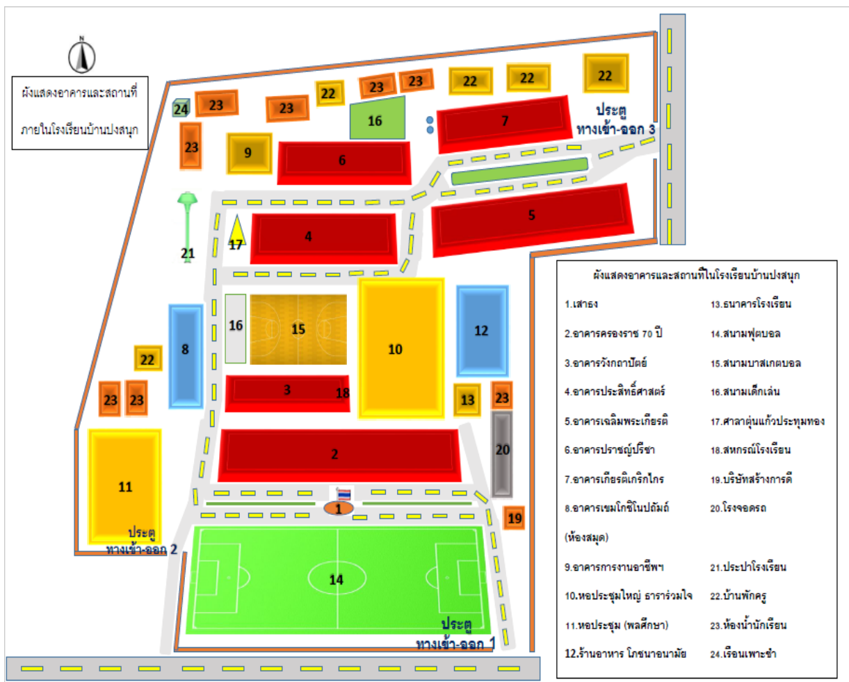
แผนผังอาคารสถานที่ โรงเรียนบ้านปงสนุก

อาคารเรียนจำนวน 6 หลัง อาคารประกอบ จำนวน 5 หลัง ส้วม 7 หลัง สนามเด็กเล่น 2 สนาม สนามฟุตบอล 1 สนาม สนามบาสเก็ตบอล 1 สนาม สนาม เปตอง 1 สนาม